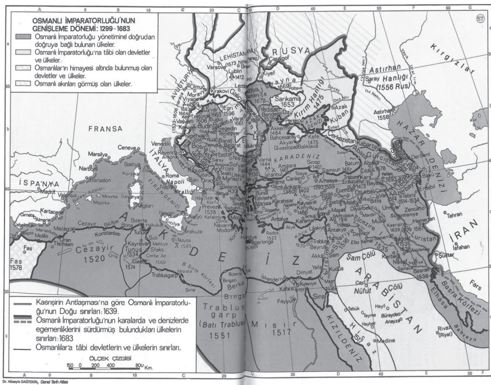
Карта 2. Ширење Османског царства између 1299. и 1683. године 130

Луристан 1587. године), Црвеним морем освајањем Басре 1538. године. Басра је, после Суеца, постала друга по величини база за опремање флоте против Португалаца. Тиме су се под њиховом контролом нашли сви путеви који су водили са Блиског истока ка Индији. Почетком 17. века, алжирски и марокански морепловци у служби Османског царства изводили су пљачкашке походе на јужне обале Енглеске и Ирске. 129