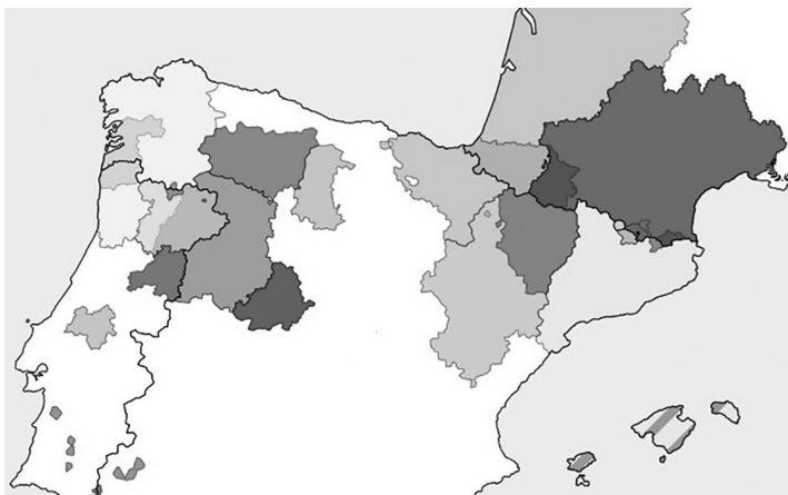
Слика 2. ЕГТС сарадње (еврорегиони) у Шпанији 2019. године