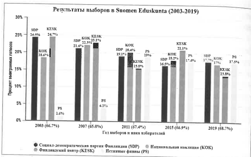
Рис. 1. Результаты выборов в парламент Финляндии (2003–2019 гг.)

подход «назад к корням», медленно наращивая потерянную поддержку избирателей 9 . Это принесло партии успех, так как через два года после ее раскола и падения до менее чем 10% поддержки ей удалось получить 17,5% голосов в 2019 г. на выборах в Эдускунта, тем самым она вернулась на финскую политическую сцену в качестве третьей по величине и влиятельности партии 10 .